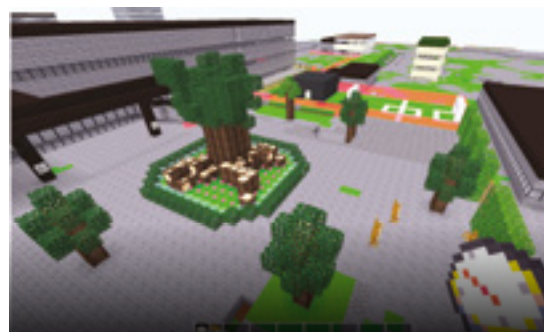
Proposition 2 Les usages sont répartis dans deux grands espaces : l'un pour les jeux collectifs un peu à l'écart, l'autre pour discuter, s'asseoir, se reposer, jouer, escalader, autour de plusieurs « arbres à palabres » qui ombragent la cour.