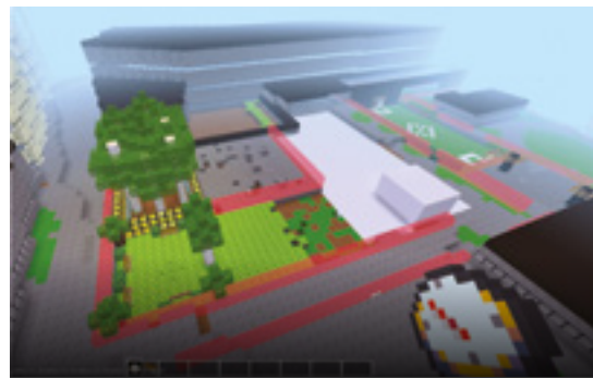
Proposition 1 Les élèves organisent plusieurs espaces aux vocations différentes, dans une gradation allant des usages les plus animés pour les jeux collectifs, aux usages les plus calmes, dans des espaces naturels propices à la biodiversité.