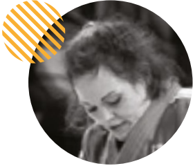
Rencontre avec Laëtitia Payet, Athlète judokate

Laëtitia Payet, athlète judokate plusieurs fois médaillée aux championnats d'Europe et championne du monde par équipe, a participé aux Jeux Olympiques de Londres en 2012 et de Rio en 2016. Aujourd'hui conductrice de travaux chez Eiffage au sein du chantier du Village des athlètes, elle témoigne de l'importance d'un Village accueillant pour les sportifs.