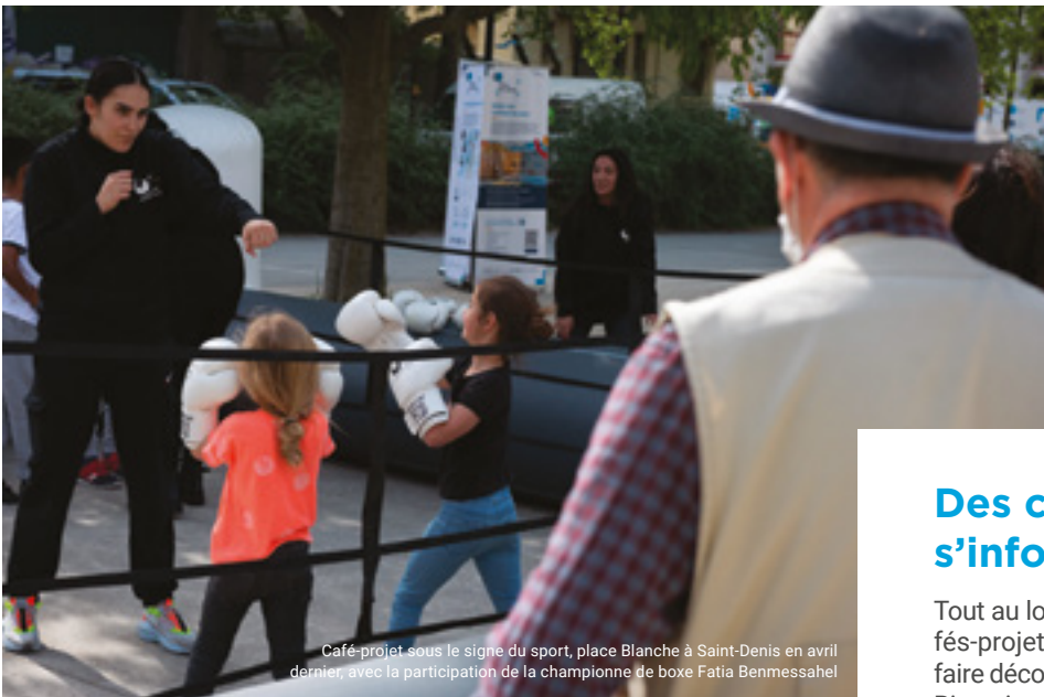
Café-projet sous le signe du sport, place Blanche à Saint-Denis en avril dernier, avec la participation de la championne de boxe Fatia Benmessahel

« Un village olympique, c'est un lieu de partage entre des athlètes de tous les sports et de tous les pays, un peu comme une maison de famille. On profite des bâtiments, mais aussi des cheminements, des bancs, des pelouses, pour rencontrer les gens, ce sont des moments importants. Quand, le soir, on fête les victoires de la journée, on aime se retrouver tous ensemble au sein d'espaces qui permettent d'échanger et de partager ces moments inoubliables. À Paris, on aura la chance d'avoir la Seine et des vues sur la tour Eiffel ou sur Notre-Dame. Les gens vont adorer ! »